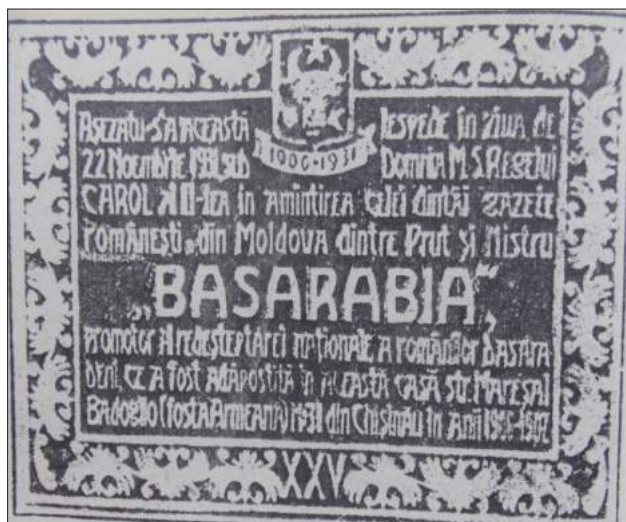
Foto 7. Tabla comemorativă dezvelită la 22 noiembrie 1931, pe fostul sediu al redacției ziarului Basarabia” (1906–1907), Chișinău, str. Armenească, 30, casa Șmakov.

S-au rostit discursuri, s-au depănat amintiri. Pe placa comemorativă era scris: