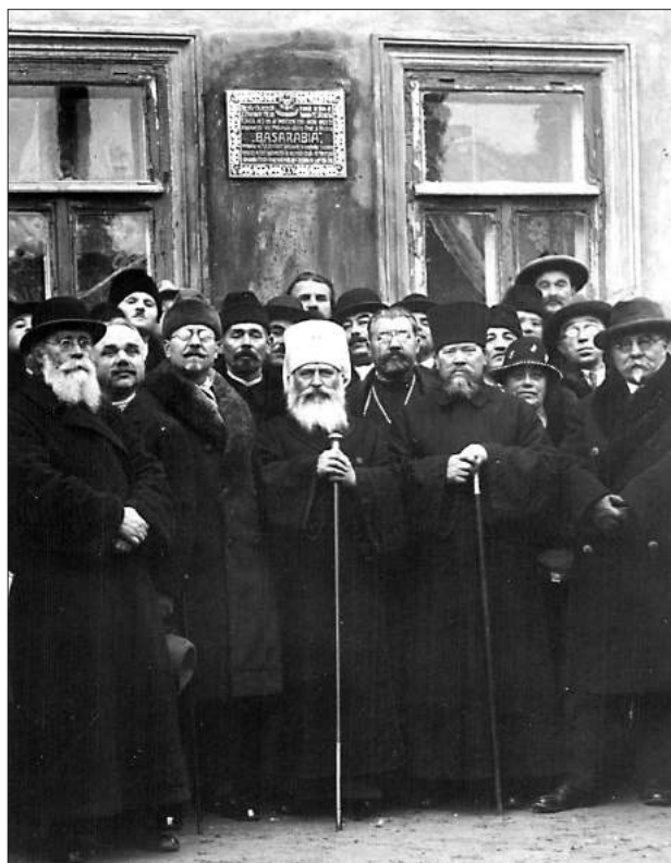
Foto 8. Momentul dezvelirii plăcii comemorative pe edificiul redacției ziarului „Basarabia”, Chișinău, str. Armenească, 30, 1931.

Din programul politic al acestei grupări naționale care-și propunea fondarea unui Partid Național Democrat din Basarabean, program publicat, în 1906, la Chișinău, sub forma unei broșuri (subsemnatul, am găsit-o într-un anticariat din București) și discutat în incinta din str. Armenească, 30, reiese că anume aici a fost rostită public pentru prima oară, probabil de către Constantin Stere, sintagma devenită ulterior celebră – Sfatul Țării. Este ceea ce am numit „misterul casei Șmacov” pe care am căutat să-l dezlegăm în timp.