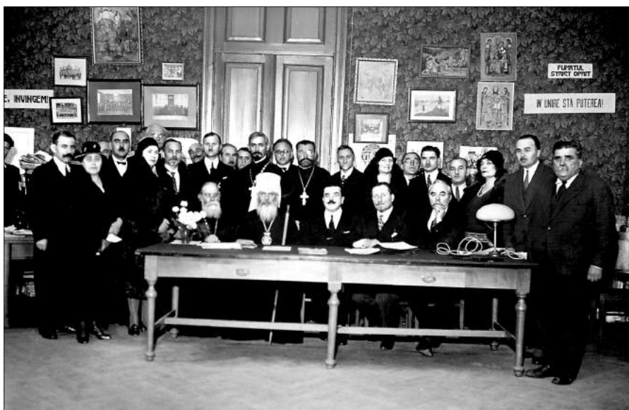
Foto 6. Foștii colaboratori ai primului ziar în limba română din Basarabia – „Basarabia” –, pozând peste 25 de ani de la prima apariție. Chișinău, 1931.

către sfat. Acest cap al țării, așa ales în țările slobode, se numește prezident, ieste cinstit de toată lumea, face legături și contracte cu alte țări; el împlinește numai voia poporului; el este numai cel mai mare dregător din țară; și dacă calcă legea, sau face după voia lui, e dus la judecată și i se ia puterea. Dar nici atâta nu e de ajuns: pentru a apăra norodu de or ce răutate se alcătuieste așa fel stăpânirea – că prezidentul nu poate face nimica cu de la sine putere; or ce hotărâre trebuie să o ia după să sfătuieste cu miniștrii; nici o hotărâre a prezidentului fără sfatul miniștrilor n-are putere de lege. Iară miniștrii sunt de a dreptul supușii sfatului țării.” [9, p. 6].