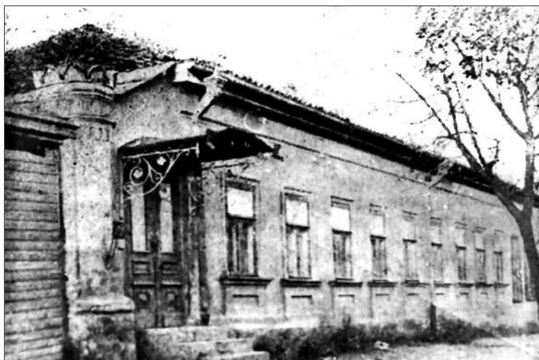
Foto 1. Clădirea redacției ziarului „Basarabia”, Chișinău, str. Armenească, 30, începutul sec. al XX-lea.