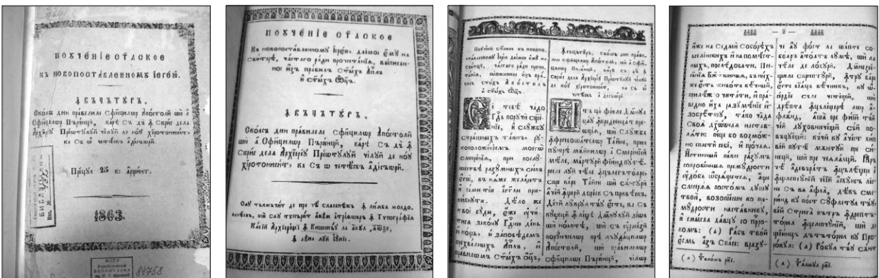
Figura 2. Pagini din cartea ПОУЧЕНИЕ АПОСТОЛЬСКОЕ... (ÎNVĂȚĂTURĂ scoasă din pravilele Sfinților Apostoli și a Sfinților Părinți...), Chișinău, 1863.

На седми Соборах вселенских и на поместных – au fost la șapte soboară atoată lumea , și la ceale de locuri ; дом твой с правдою строй, нетомительно –