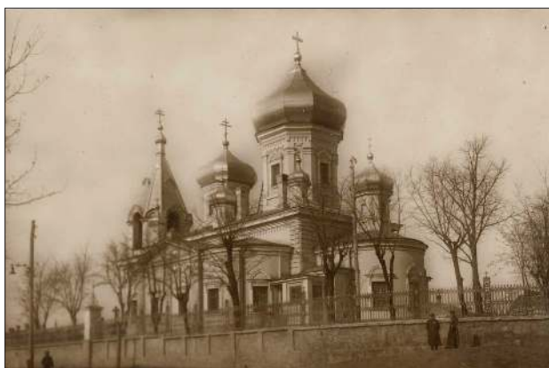
Chișinău, Biserica Ciuflea.

O reușită indiscutabilă sunt capitolele 3 și 4: Specificul creației arhitecților din Basarabia (1812 – anii '30 ai secolului al XIX-lea) și Particularitățile creației arhitecților din Basarabia (anii '30 – '50 ai secolului al XIX-lea) , autoarea introducând în circuitul științific date inedite sau mai puțin știute despre arhitecții, ingineri cadastrali și militari. Sunt prezentate biografiile a 90 de arhitecți și ingineri care au format imaginea orașelor din Basarabia – Mihail Ozmidov, Egor Foerster (Förster), Ivan Hartingh, François Paul Sainte de Wollant, Iosif Bettini, Andrei Rosițki, Bogdan Eitner,