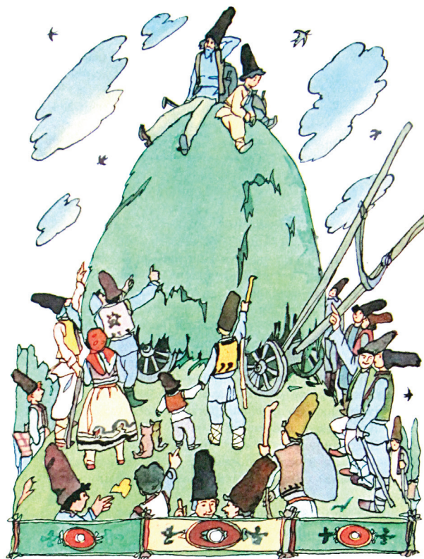
Ilya Kabakov (Rusia). Isprăvile lui Guguță , 1972

La hotarul secolelor XX–XXI, Sp. Vangheli a editat două volume noi de povestiri istorice, cu un puternic mesaj educativ, care evoca unele momente ale vieții Basarabiei antebelice și imediat postbelice. Cartea Tatăl lui Guguță când era mic [47], în care scriitorul relatează despre satul din timpul copilăriei sale, a fost ilustrată de graficianul Ion Moraru (n. 1950), înalt apreciat de către autor 14 . Compozițiile realizate în tehnica creionului moale colorat, una marcantă pentru grafica de carte din republică în perioada primului