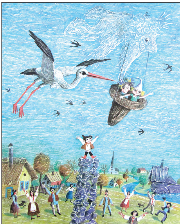
Boris Diodorov (Rusia). Steaua lui Ciuboțel , 1984

tre stilul vizual și cel literar care se stabilește la diferite niveluri narativ-semantice. Astfel, se evidențiază afinități de concepții plastice, ilustrațiile combinând esteticul cu cognitivul, dezvoltând la copii gustul pentru frumos, sentimentul de armonie cromatică, curiozitate, dragoste față de plaiul natal. Spiritul noului, prezent în ilustrații, se contopește cu măiestria desăvârșită, inerentă perfecțiunii limbajului plastic ales de artist [68; 70].