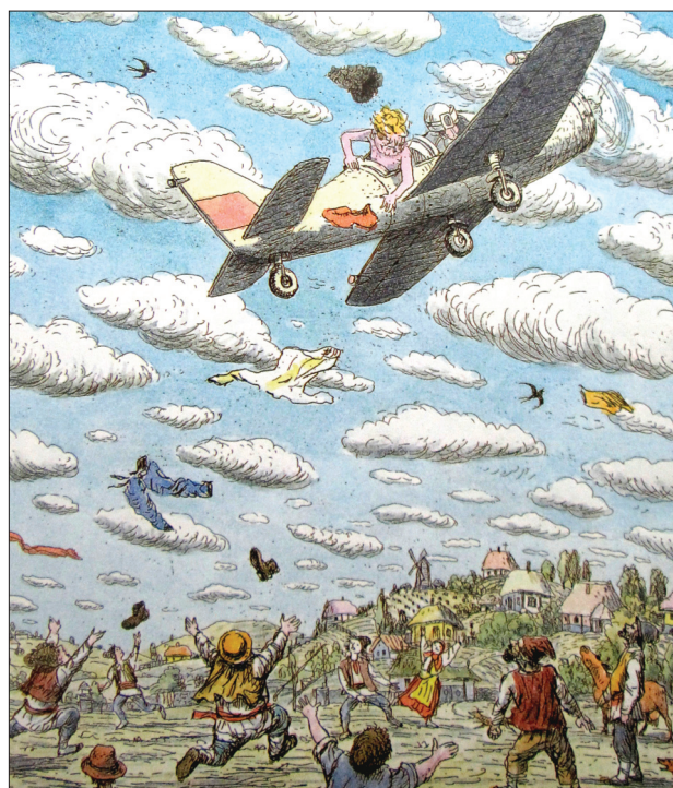
Boris Diodorov (Rusia). Isprăvile lui Guguță , 1991