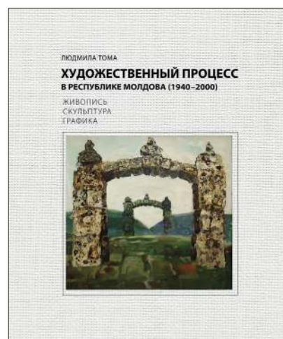
Ludmila TOMA. Procesul artistic în Republica Moldova (1940–2000). Pictură. Sculptură. Grafică/ Художественный процесс в Республике Молдова (1940–2000). Живопись. Скульптура. Графика. Combinatul Poligrafic, 2018. –247 p. +200 il.