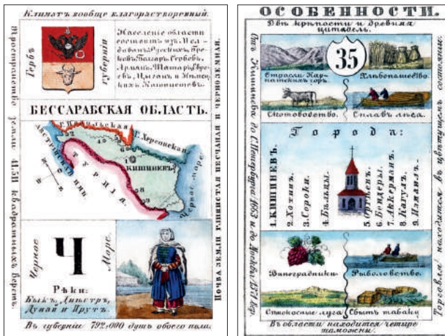
Figura 2. Cartea de joc ce reprezintă Basarabia din colecția Albumul hărților geografice ale Rusiei, amplasate pe 80 de file după bazinele mărilor, sau Grande Patience remarquabil și educativ pentru copii (1859).

Cartea dedicată Basarabiei (figura 2) include următoarele informații: A. Pe avers: 1) Denumirea – Basarabia. Suprafața 41 511 de verste pătrate, numărul populației – 792 000 de suflete de ambele sexe, harta guberniei cu cele mai mari orașe și râurile, hotare cu guberniile Herson și Podolia și cu statele Imperiul Austriei și Turcia; 2) Caracteristici etno-naționale – lista etniilor locuitoare: moldoveni, ruși, greci, bulgari, sârbi, armeni, tătari, evrei, țigani și coloniști germani, pictura unei femei moldovence în port național care la fel ca și în primul caz nu corespunde realității; 3) Caracteristicile condițiilor geografice ale regiunii: tipurile de sol predominant sunt cel nisipos-lutos și cernoziomul, caracterul climei prielnic, rețeaua hidrografică este formată din râurile Bâc, Nistru, Dunărea, Prut și Marea Neagră.