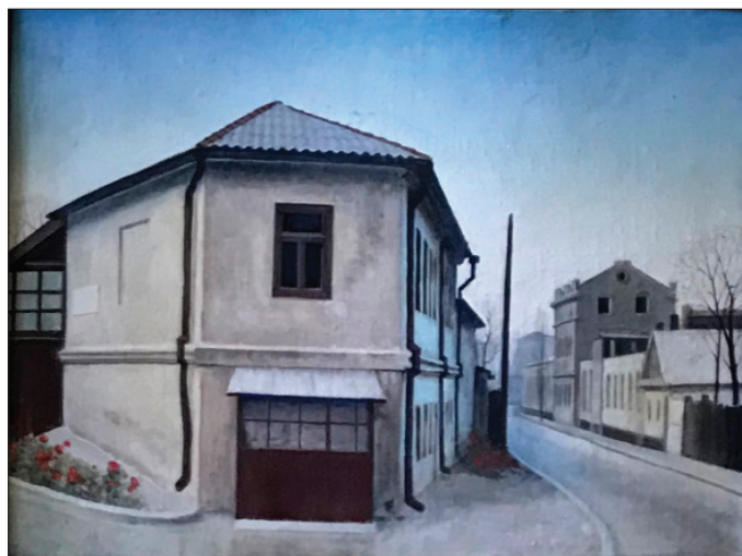
Intersecție chișinăuiană 2 . 1974, acryl, pânză pe carton, 70 × 50 cm.