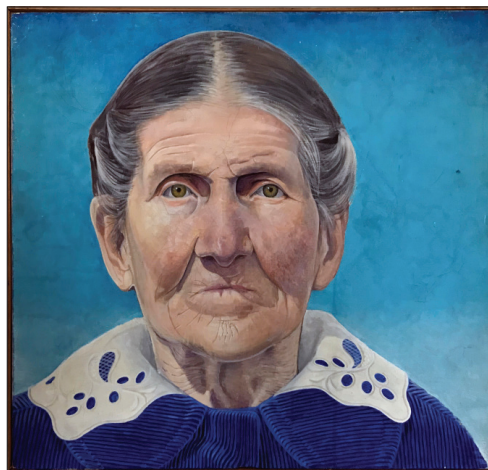
Bunica Leonea . 1976, acryl, ulei, pânză, 60 × 55 cm.

A organizat expoziții personale la Muzeul Național de Artă al Moldovei (2004, 2013, 2017, 2022). Distins cu Diploma de gradul II la Concursul Republican de Desen pentru cartea Umbrela (1978), Diploma de gradul III pentru Albinuța (1979); Premiul Cartea