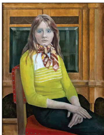
Irina în galben , 1975, ulei, pânză, 70 × 90 cm.