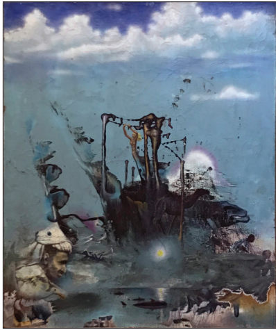
Naufragiu în deșert , 1973, ulei, pânză, 60 × 70 cm.

lui, personajele sale, frumoase și armonioase la chip, anunță mereu și o plenitudine interioară. Format în ambianța atelierului de familie care era vizitat de marii nonconformiști ai timpului – Mihail Greco, Igor Vieru, Vasile Zagorschi, Petru Cărare, Emil Loteanu, Dumitru Fusu, actori ai Teatrului „Lucefărul” ș.a., Lică Sainciuc a fost martor al unui fenomen artistic în dezvoltare la care și-a raportat propria creație și valori, și-a stabilit prioritățile estetice și umane.