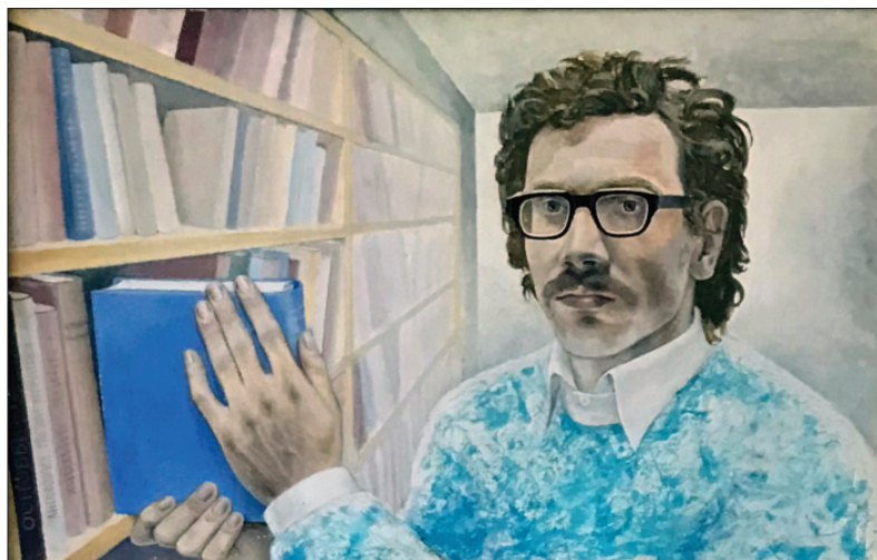
Portret de sine. 1974, ulei, acryl, carton, 80 × 50 cm.

Cu picturile sale pe tema Chișinăului consună expoziția de fotografii Chișinăul în culori inaugurată la Muzeul de Istorie a orașului (2022), care renaște prin cele 16 imagini color ale mai multor monumente de arhitectură dispărute în timp și restabilite de Lică Sainciuc: Hotelul Elveția (a doua jumătate a sec. al XIX-lea), distrus în 1941, Vedere înspre Orașul Vechi de pe clopotnița Soborului Nou – se văd bisericile Sf. Ilie și Soborul Vechi, distruse în anii '50, Biserica și Clopotnița Luterană (a doua jumătate a sec. al XIX-lea), distruse în anii '60 etc. Precizăm că din arhitectură, în