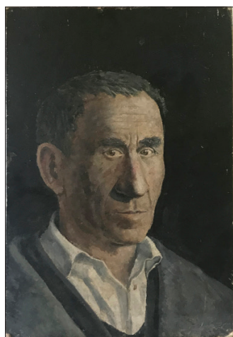
Glebus. 1971, ulei pe carton. 35 × 50 cm.

nu și Mihail Grecu criticate la Chișinău, dar expuse și mediatizate în cadrul expozițiilor din Moscova [4].