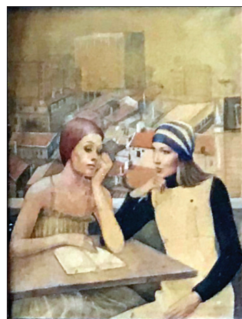
Studente , 1975, guașă, hârtie, 27 × 34 cm.

le sale despre viață cer efort și lecturi profunde pentru a le percepe. În ultima carte pe care o semnează, Muma Calle. Reconstrucții matriarhale de Lao-Tzu (Editura „Codobelc”, 2021), sunt concentrate teze patriarhale despre imagini care nu suportă tălmăciri... Înțelepciunea este o boală și face parte din ceea ce numim sănătate atâta timp cât nu-i multiplici percepția: fie prin modelare cu roata olarului, metoda Gutenberg, printer 3D, liturgii învățate la Catihet etc. Geometria reflecției și refracției ține de iluzia văzutului: multiplicarea și distorsionarea nu fac altceva decât să ducă până la totala și eterna înțepenire a universului subiectiv [2; 3].