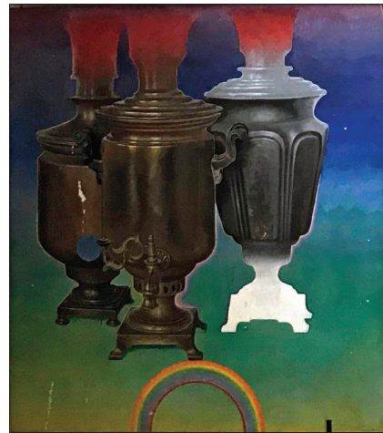
Trecerea samovarelor , 1975, acril, pânză, 68 × 73 cm.