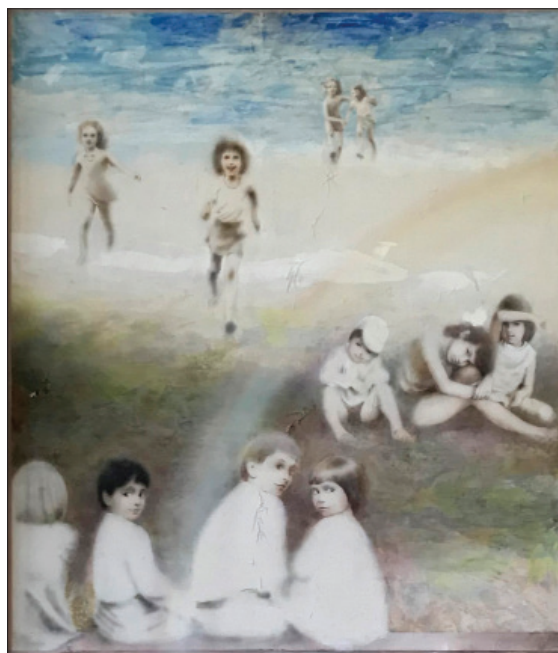
Copilăriile , 1978, acryl, pânză, aerograf.