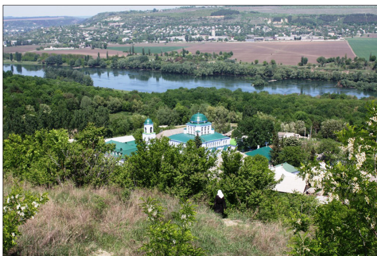
Mănăstirea Japca (foto: Ion Valer Xenofontov, 11 mai 2012).