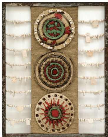
Tradiții , 2018, șamotă, glazură, materiale diverse, 250 × 740 mm.

Una dintre lucrările relevante din perioada de debut, compoziția Destin (1996), încorporează în structura sa cinci piese cu particularități accentuate de orchestrare spațială a formei motivelor, cu simbioze inedite ale șamotei, porțelanului și glazurii, compoziția punând în evidență și specificul procesului tehnologic. Conceptele identitare, abordate anterior de către ceramistă în cele două piese ale compoziției Taina mitului (1990), sunt abordate original prin motive inspirate din creația arhitecturală populară, arhitectonica formelor rurale tradiționale căpătând o nouă destinație funcțională și sonoritate semantică. Însăși denumirile lucrărilor din seria Destin: Destin I, Destin II, Destin III, Destin IV, Destin V a favorizat în cadrul diverselor expoziții perceperea și talmăcirea mesajului încifrat. Or, prin noile contexte formale în procesul de amplasare în spațiul expozițional a pieselor, ceramista creează noi contexte plastice generatoare de semnificații semantice memorabile.