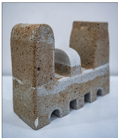
Destin II , 1996, șamotă, porțelan, glazură, 260 × 200 × 100 mm.

bază conceptuală a creației, sunt suplinite cu mesaje izvorâte din particularitățile de constituire morfologică a formei ceramice, de modalitățile de constituire a discursului plastic, de stilul inconfundabil al artistei. Or, așa opere precum: Diversitate (2019), Începutul (2019), Formă (2020), Forță elegantă (2020), Alternanță I (2020), Alternanță II (2023), Pe verticală (2021), Secvențe I (2023), Secvențe II (2023), Formula I (2024), Formula II (2024), Formula III (2024), Ondulație (2024), relevă magistral capacitatea autoarei de a pune în evidență relațiile material-formă-mesaj și, ca rezultat al acestor experimente relaționale, de a identifica și promova individualitatea propriei creații.