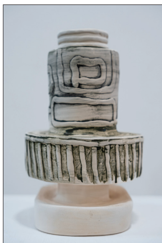
Formula I , 2024, șamotă, smalțuri, 160 x 170 x 180 mm.