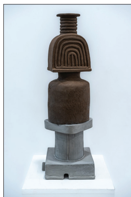
Trăiri , 2023, șamotă colorată, 200 × 200 × 600 mm.

încrustate I (2012), Forme încrustate II (2016), Imensitate I (2018), Imensitate II (2018), ale căror repere conceptuale și-au găsit, în consecință, o împlinire artistică generalizatoare în lucrarea Tradiții (2018), pun în valoare, prin modul de plămădire ideatico-artistică, și mentalul popular autohton.