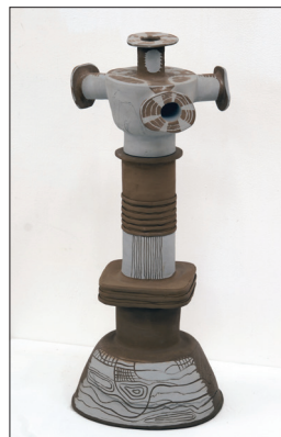
Alternanță II , 2023, șamotă colorată, 650 x 250 x 300 mm.

Însăși faptul că pereții și decorul fiecărei piese în parte este diferit creează condiția ca artista să poată promova o diversitate de expresii și mesaje originale. Astfel, interferențele create de coeziunea pieselor Destin III cu Destin V , sau a pieselor Destin I cu Destin VI suplinesc demersul plastic al acestui set de piese ceramice cu expresii semantice suplimentare, diferite de ale aceleiași compoziții orientate rectiliniu, haotic sau circular. În plus, piesele își păstrează expresivitatea chiar și în cazul când fiecare dintre acestea sunt prezentate în spațiul expozițional ca operă singulară. În contextul dat este reprezentativă piesa Destin II care, fiind expusă aparte, își amplifică forța expresivă prin slăbirea valențelor descriptive în favoarea expresiilor metaforico-simbolice. Maniera de operare cu componentele piesei, prin însăși modul de combinare a lor într-un organism unitar, contribuie iminent la edificarea unei imagini înzestrate cu o distinsă forță expresivă asemănătoare celor generate de structurile