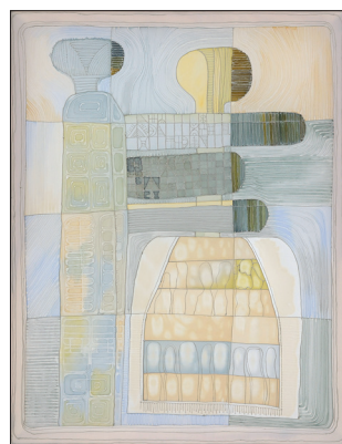
Cugetări în timp , 2024, tehnică mixtă, 750 × 950 mm.

Țesătura în calitate de suport pentru piesele ceramice este utilizată de către Tatiana Vatavu și în compoziția Dialog (2021), aceasta incluzând cinci piese în care motivele profund stilizate decorativ sunt aplicate pe materialul textil garnisit prin coasere. Elementele ceramice preponderent plate sunt însoțite de elemente grafice liniare ale motivelor de sorginte abstractă inserate pe suprafața materialului textil.