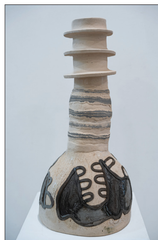
Secvențe I , 2023, șamotă colorată, smalțuri, 250 x 260 x 500 mm.