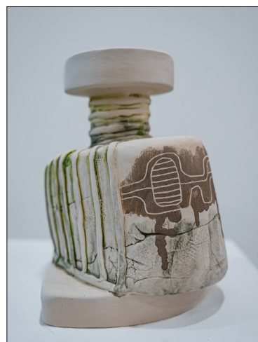
Formula II , 2024, șamotă, smalțuri, 150 × 170 × 200 mm.

Ca și în arta ceramicii, în care Tatiana Vatavu combină frecvent diverse materiale – șamotă, porțelan, glazură, în arta imprimeului artistic autoarea îmbină într-un mod original diverse materiale textile precum mătasea, țesătura din bumbac sau in. Exersarea plastică în ceramică, cât și în arta imprimeului pe materiale eterogene, intercalarea acestora în structura compozițională a lucrărilor stau la baza universului conceptual-tematic al Tatiane Vatavu, identificându-i creația în ambianța culturală din Republica Moldova ca pe una deosebită. Or, adesea, subtilitatea expresiilor artistice rezidă anume în contrastele dintre duritatea materialelor ceramice și asprimea sau finețea celor textile și influența acestora asupra mesajului lucrării al