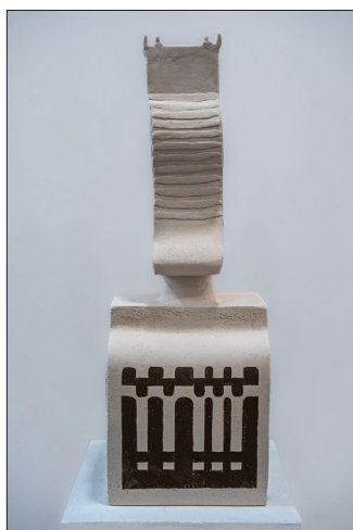
Secvențe II , 2023, șamotă colorată, 220 × 250 × 640 mm.

De altfel, conceptul ideatic al lucrării Tradiții (2018) și-a găsit o realizare plastică originală, pe de o parte, mulțumită structurării compoziționale pe verticală a unor piese ceramice cu forme rotunde, pe de altă parte, grație exersării de către ceramistă a unor procedee tehnologice mixte de îmbinare a diverselor materiale precum șamota, glazura, țesătura aspră de proveniență industrială și metalul. Piesele rotunde, constituind elemente și motive centrale ale compoziției, asemănătoare cu forma tradițională a platourilor, au fost modelate prin expresii proeminente. Motivul Soarelui, specific creației populare, este accentuat de ritmul ascendent al multiplelor forme de proporții mici asemănătoare pandantivelor care, întregind structural elementele imaginii într-un univers artistic expresiv, atribuie operei valoare simbolică.