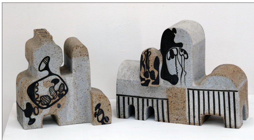
Destin III, V , 1996, șamotă, porțelan, glazură, 200 × 330 × 100 mm, 230 × 240 × 100 mm.

Deja în primele lucrări ceramice realizate de către Tatiana Vatavu (Emilian) în timpul studiilor și după absolvirea Academiei de Muzică, Teatru și Arte Plastice din Chișinău (1990), printre care Martir I (1989), Martir II (1990), Taina mitului (1990), Singurătate , Nemurire și compoziția Destin (1996), se reliefează cu plenitudine aspirațiile tematice și cele plastice ale tinerei artiste. O particularitate esențială a lucrărilor sale de debut rezidă în faptul că autoarea „... nu «obosește» suprafața lucrărilor cu diverse culori și nuanțe. Decorul este realizat în mare parte dintr-un material ce permite obținerea unor nuanțe foarte fine ale culorilor” [1. p. 90].