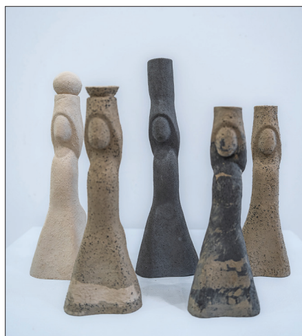
Grație , 2018, șamotă, 70 × 100 × 300 mm.

Nu întâmplător, de exemplu, de-a lungul anilor, ceramista revine la tema perpetuării în timp a tradițiilor culturale populare prin completarea ciclului Destin cu piesa Destin VI (2012), fapt ce denotă importanța valorică pentru creația artistei atât a aspectelor tematice abordate, cât și a valențelor plastice împlântate în structura compozițională a operei, maniera de consti-