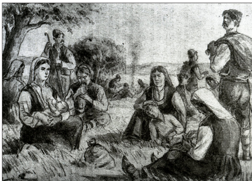
Coloniști bulgari și găgăuzi din sudul Basarabiei. Pictor B.N. Șirokorad. Muzeul Național de Etnografie și Istorie Naturală. Cota arhivistică: inv. 2485

Monografia domnului dr. Oleg Bercu este o prețioasă lucrare de sinteză ce pune în valoare o comunitate etnică care pe parcursul istoriei și-a consolidat propria identitate și care treptat se racordează la noile schimbări regionale și globale.