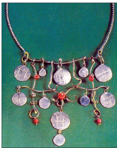
Colier Moldova . Orujeynaya Palata, Moscova.