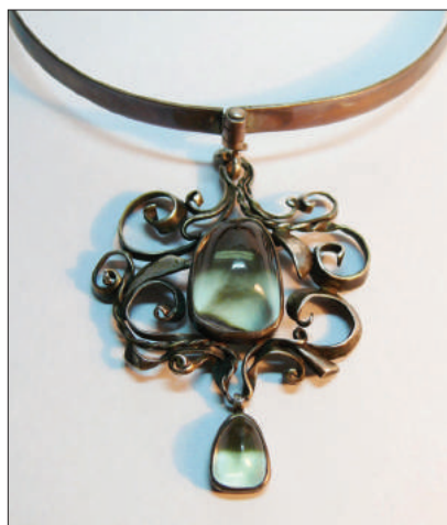
Colier Daria . Colecție privată.

O creație deosebită ca tehnică de executare și motive utilizate este inelul Marina , având un caboșon perfect rotund, un crisopraz de un verde deschis, montat într-un șaton închis. Compoziția reprezintă