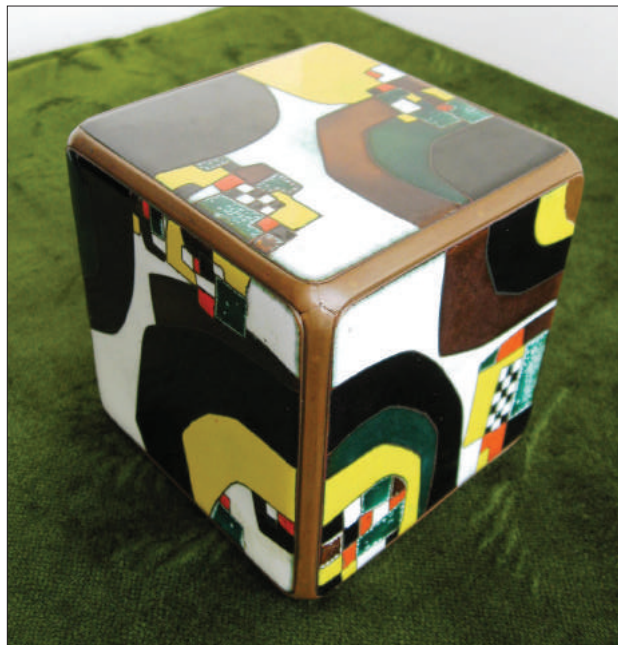
Cub emailat Plai natal , colecție privată.

Este de remarcat faptul că toate articolele sale A. Marco le-a confecționat după schițe și design proprii. Din aceste considerente, piesele de giuvaiergerie dețin poansonul personal al meșterului, fapt ce ridică semnificativ prestața lor. Poansonul este format dintr-un cerc miniatural, cu inițialele frumos caligrafiate AM ,