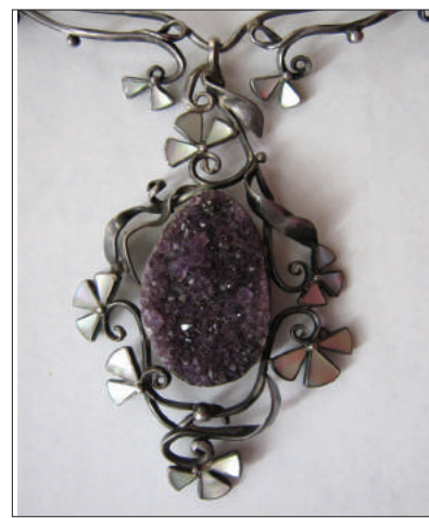
Colier. Argint, sidef, ametist. MNAM.