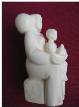
Madona cu pruncul . Fildeș, colecție privată.