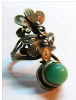
Inel Marina . Colecție privată.

Colierul din setul Moldova reprezintă o salbă monetară stilizată, confecționată dintr-o bară metalică integră, răsucită proporțional, oferind impresia unei împletituri decorative. Centrul compoziției include elemente ornamentale, discuri aplatizate și laminare în formă de monede, asociate cu mici inserții de coral roșu-portocaliu. Mărgelele de coral au mici orificii, prin care este strecurată sârma laminată, pliată în forma unei spirale, acordându-i-se forma vrejului de viță-de-vie. Simbolurile utilizate sunt frecvent întâlnite pe prosoape naționale, covoare, broderii artistice, în decorul pieselor de lemn sau de metal (fântâni, garduri, grile metalice), fiind parte integrantă a culturii autohtone. Colierul dispune de elemente decorative în formă de spirală ca simbol al continuității vieții, al mișcării, vrejul de viță-de-vie fiind elementul național sugestiv pentru o regiune, economia căreia este baza-