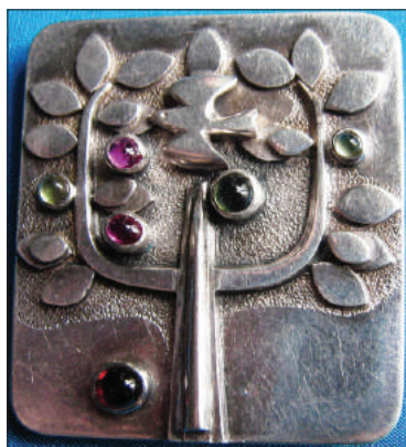
Broșă Arborele vieții , argint, colecția MNIM.

Articolele create de Alexei Marco au fost repertoriare în funcție de materiile prime și tehnicile de lucru în următoarele categorii: 1) plastica miniaturală , pentru care folosește fildeșul, creând piese de cca 7-10 cm; 2) sculptura decorativă de proporții mici , care include piese expresive, realizate din aramă forțată, sculpturi