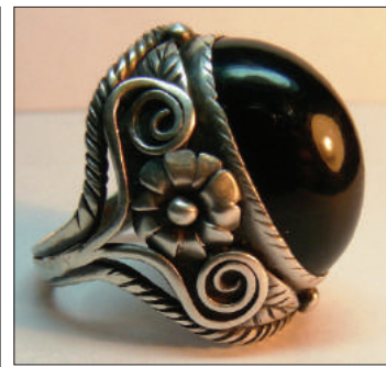
Inel Daria . Colecție privată.

tă, în mare parte, pe viticultură și vinificație. Podoaba posedă de asemenea simboluri și motive geometrice, precum romburi, cercuri ca emblemă solară, linii drepte și intercalate.