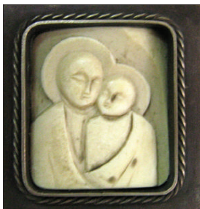
Medalion Madona cu pruncul . Fildeș, argint, colecția MNAM.

În arta decorativă națională Alexei Marco s-a afirmat mai ales în domeniul emailării cloisonné . Placheta emailată Țăranii (1988) scoate în prim-plan un grup de țărani (doi bărbați și trei doamne), îmbrăcați în veșminte de gală. Femeile poartă catrințe specifice portului țărănesc femeiesc, baticuri, ca simbol al căsniciei, tânăra domniță având părul lăsat pe spate, bărbații sunt înveșmântați în sumane lungi, purtând căciuli de cărlan, un simbol al imaginii moldoveanului în perioada sovietică. Ca fundal pentru compoziția în cauză a fost folosită imaginea satului – elegante căsuțe