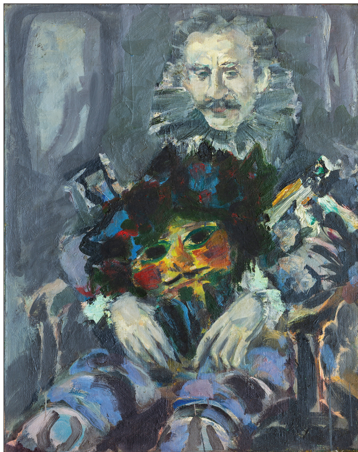
Dumitru Peicev. Glebus Sainciuc , 1989, u. p., 75 × 60 cm.

NOTĂ. Cercetările au fost efectuate în cadrul Proiectului 20.80009.7007.04 Biotehnologii și procedee genetice de evaluare, conservare și valorificare a agrobiodiversității (2020–2023) și subprogramului 011102. Extinderea și conservarea diversității genetice, ameliorarea genofondurilor de culturi agricole în contextul schimbărilor climatice (2024–2027).