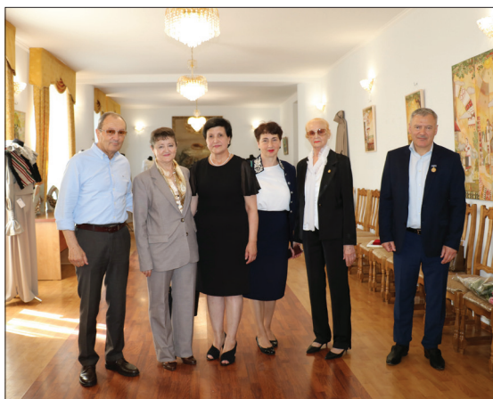
Expoziția de arte decorative organizată de Ziua AȘM, 12 iunie 2024.

Simpozionul aniversar „Ion Gagim: lumea și oamenii vieții mele”, desfășurat pe 31 mai curent la Uni-