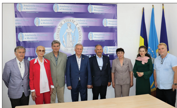
Întrevederea membrilor Prezidiului AȘM și a membrilor conducerii Academiei de Științe din Lituania, 13 iunie, 2024.