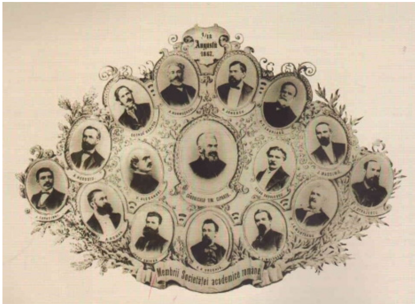
Membrii fondatori ai Academiei Române

Academia Română a condamnat anexarea sovietică din 1940 prin cuvintele președintelui ei de atunci, Constantin Rădulescu-Motru, și, totodată, s-a adresat printr-un apel academiilor lumii „surori din lumea întreagă”, solicitându-le „ajutor” și „sprijinul moral de care simte nevoie”. Îar în 1991, când Basarabia istorică se elibera de un regim opresor, Adunarea Generală a Academiei a salutat „cu nețărmurită bucurie proclamarea în consens cu principiile sale ale dreptului la autodeterminare a independenței Republicii surori Moldova”. Membrii Academiei Române se declarau solidari cu actul istoric al proclamării independenței Republicii Moldova, considerându-l „drept o etapă necesară pe drumul reîntregirii firești a neamului român”.