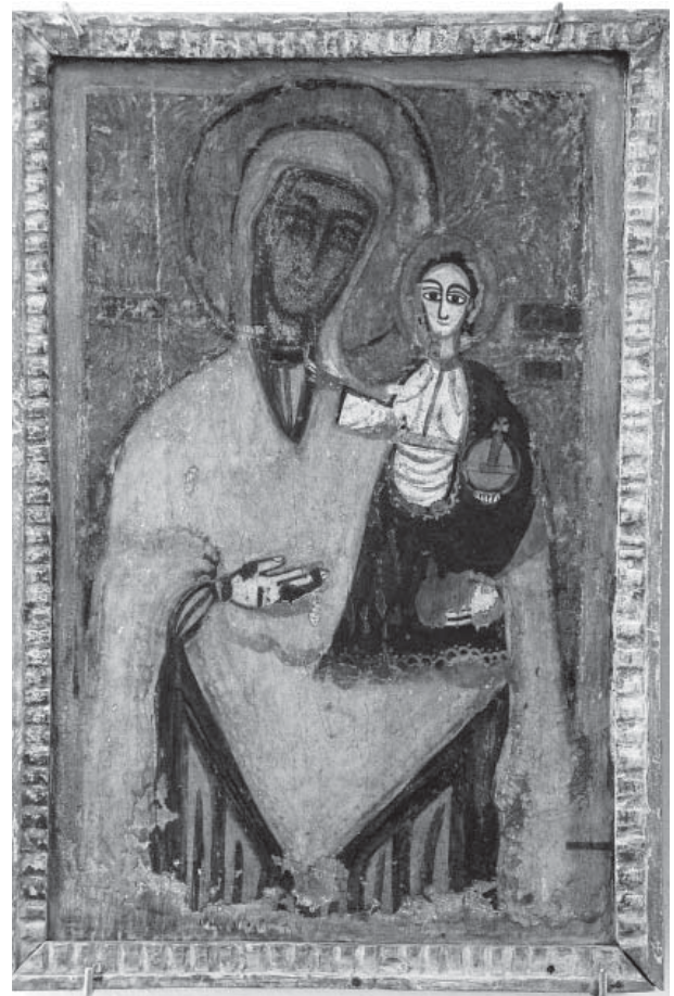
Icoana Împărătească Maica Domnului Hodighitria (Indrumatoare). XVII. Din colecțiile Muzeului Național de Arte Plastice

1936); „Teza existenței unei limbi moldovenești diferite de limba română este, atunci când e de bună credință, o iluzie și o greșală, cel puțin extrem de naivă; iar când e de rea credință, e o fraudă științifică” (Eugeniu Coșeriu, 1921-2002); „Adevărul e că nu sunt două limbi identice cu numiri diferite, ci o singură limbă de cultură și că ea are o singură denumire – LIMBA ROMÂNĂ” (Silviu Berejan, n. 1927). Să cităm și afirmațiile unui clasic în viață care este Ion Druță (n. 1928) inserate în eseul Domniei sale Răscrucea celor proști : „Cum o numim până la urmă? Firește, limba română. După ce am călătorit prin mai multe imperii, ne folosim de limba fiartă și cizelată de frații de peste Prut în cazanele naționale” . Iată ce zice un alt scriitor, academician, Mihai Cîmpoi, atins și el, ca și Druță, de aripa geniului: „Limba română este rostirea esențială a ființei poporului nostru, din care putem deduce modul său de a gândi, de a simți și de a exista în și întru istorie” (Mihai Cîmpoi, n. 1942); „Cetatea care ne-a ținut mereu trează conștiința de apartenență