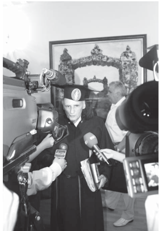
Grigore Vieru: “Am răsărit ca poet din frumusețea, bogățiile, și tainele Limbii Române”

Un pamflet plin de vervă satirică publicase Vasile Coroban pe la sfârșitul anilor '50 ai secolului