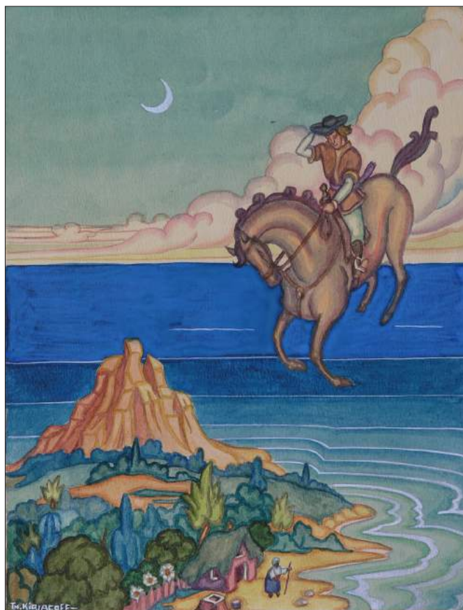
Theodor Kiriacoff. Făt-Frumos din lacrimă , 1940.