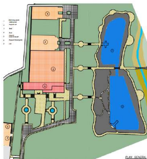
Figura 2. Planul general al complexului „Château Purcari”.