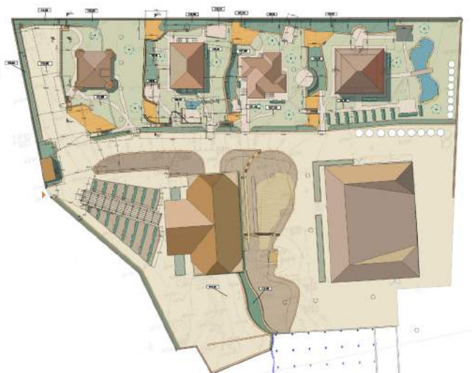
Figura 9. Planul general al complexului vitivinicol „Château Vartely”.