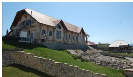
Figura 8. Restaurantul complexului.