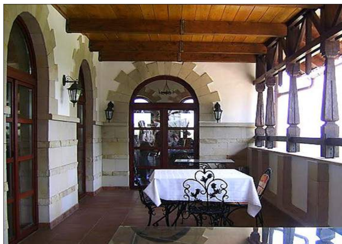
Figura 5. Terasa restaurantului.