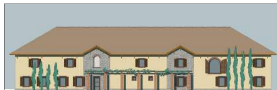
Figura 7. Fațada blocului ce include secția de îmbuteliere și laboratorul.