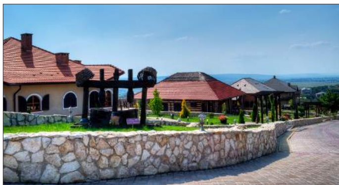
Figura 6. Vedere spre vilele complexului „Château Vartely”.