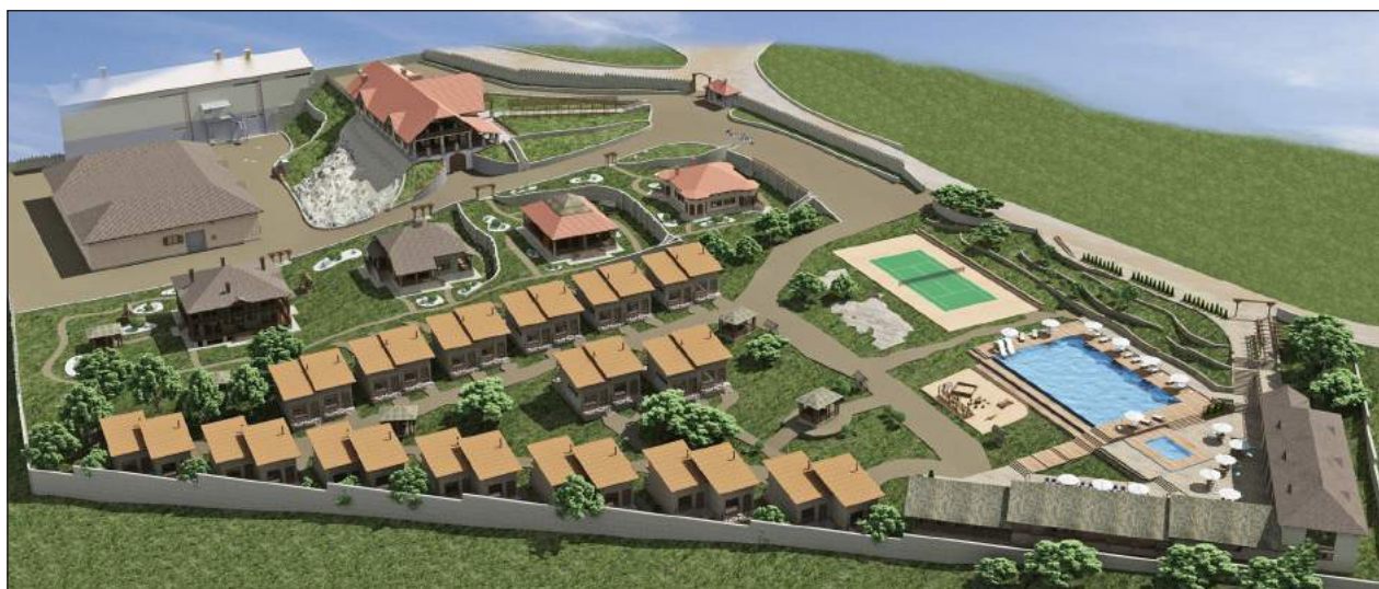
Figura 11. Propunerea de extindere a complexului „Château Vartely”.