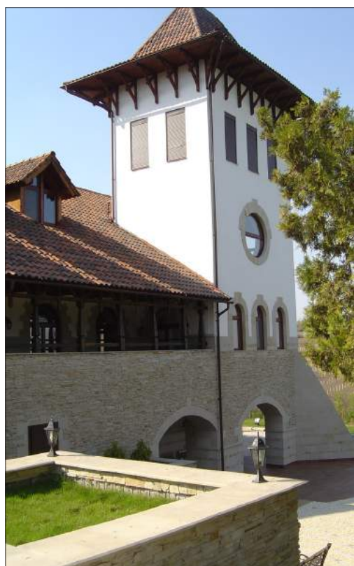
Figura 4. Vedere spre turnul clădirii.