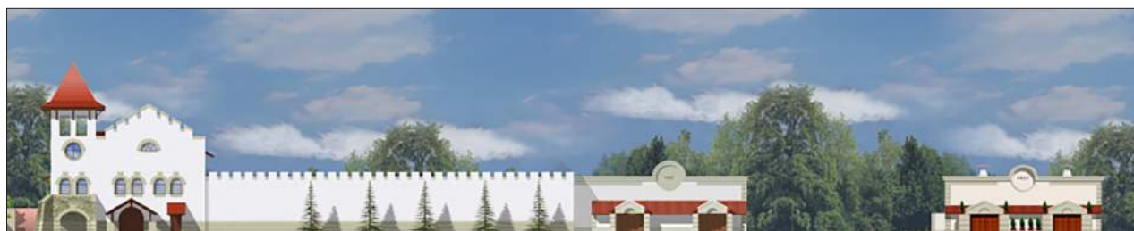
Figura 1. Desfășurarea fațadelor pe latura vestică a complexului „Château Purcari”.