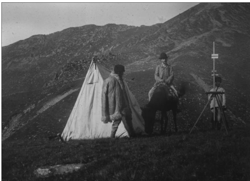
Foto 1. Tânărul E. de Martonne (pe cal) în studiile sale de teren pentru lucrarea de doctorat, în România, între anii 1898–1900.

Reprodusă în: Gaëlle Hallair. Les carnets de terrain du géographe français Emmanuel de Martonne (1873–1955): méthode géographique, circulation des savoirs et processus de visualisation