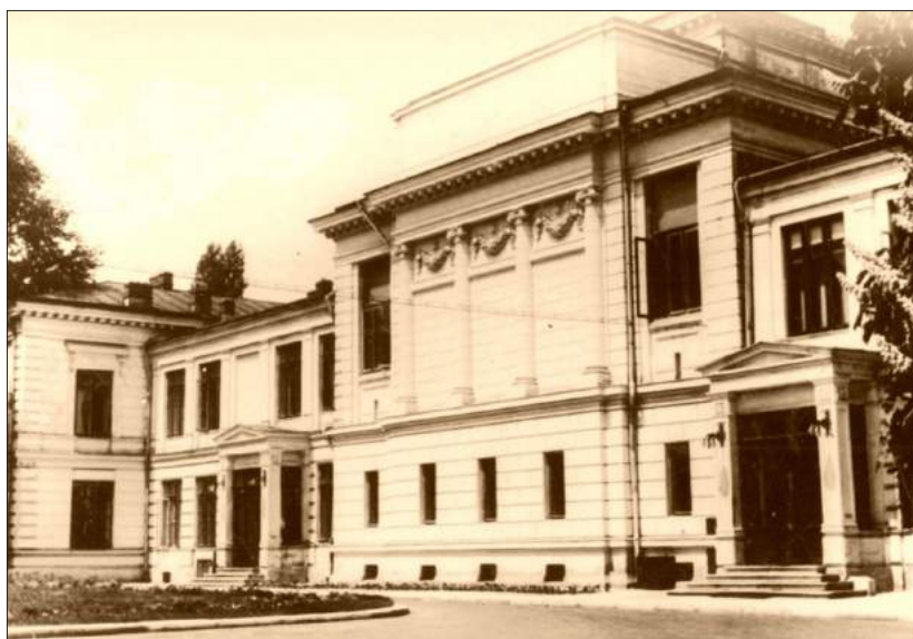
Foto 2. Clădirea Academiei Române în perioada interbelică.