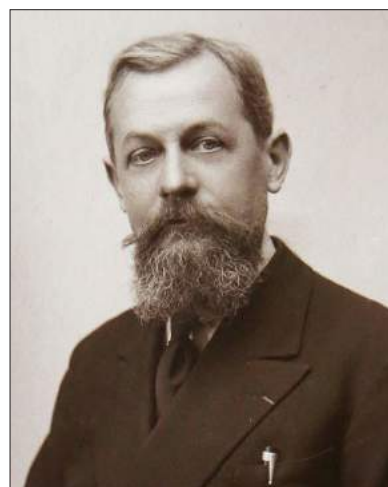
Membru de onoare al Academiei Române Emmanuel de MARTONNE (1873–1955)

Cuvinte-cheie: Academia Română, geografie franceză, geografie română, Emmanuel de Martonne, Simion Mehedinți, recunoaștere academică.