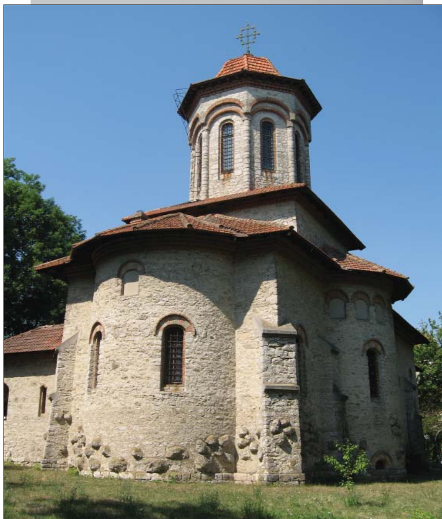
Biserica „Sf. Treime” (1913), Cuhureștii de Sus

7. Istoricul Petru Vicol (Arhiva Națională a Republicii Moldova), în comunicarea Contribuții la biografia academicianului Iustin Frățiman , în baza mai multor documente inedite, a adus noi precizări la biografia cunoscutului istoric al bisericii și fruntaș al mișcării naționale românești din Basarabia, sprijinind ideea lansată în anii precedenți ca Liceul Teoretic din Cuhureștii de Sus să poarte numele ilustrului înaintaș.