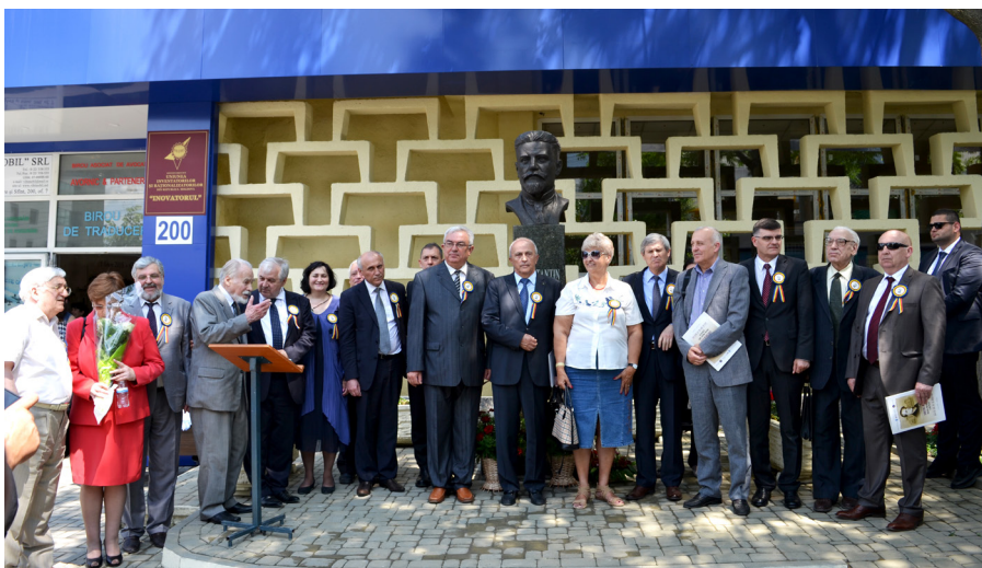
Inaugurarea bustului lui Constantin STERE în fața Universității de Studii Politice și Economice Europene „Constantin Stere” din Chișinău, 1 iunie 2015.