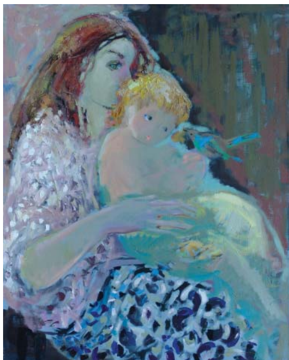
Mamă cu copil. 2005, 900×700 mm, u/p