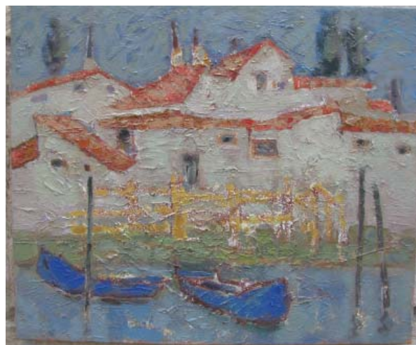
Murano. 2012, 500×600 mm, u/p

spiritului de modernitate al picturii naționale și universale.