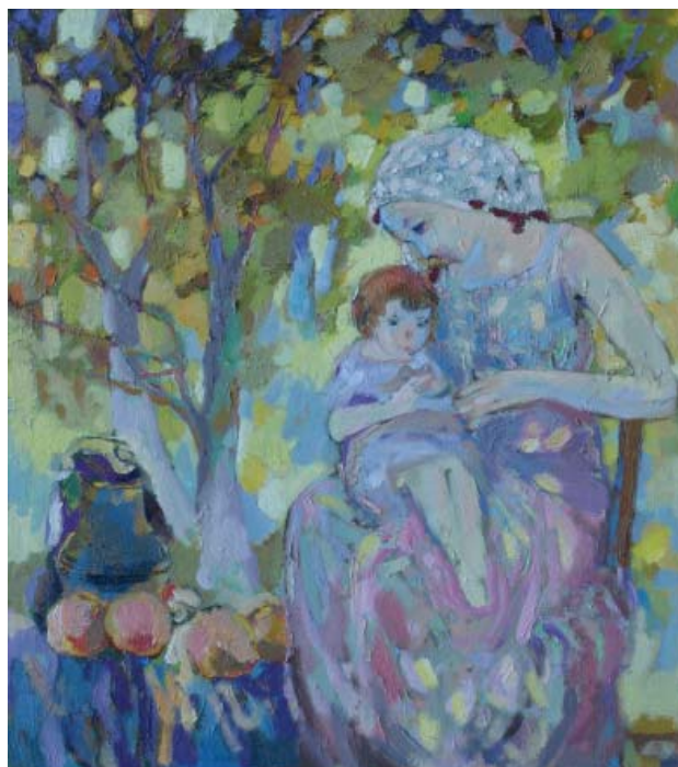
În livadă. 2002, 900×800 mm, u/p

în peisajele sale personaje, iar dintre acestea femeia joacă un rol determinant. Autoarea pictează femeile în culori bogate, temperate sau îmbogățite prin umbre calme și lumini strălucitoare. Gama uluitoare a trăsăturilor sale de penel este relevată de felul liber în care au fost tratate modelele. Pulsația de culori calde și reci și licărul nenumăratelor tușe ale unei pensule subțiri, formează o palpabilă prezență. Pictorița nu dorește reprezentarea strictă a unei femei, ci a unui tablou... mișcător și frumos.