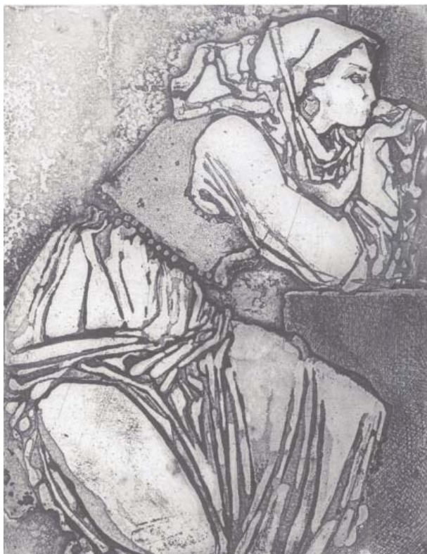
Seria M.Eminescu. De dragoste . 1986, 200×150 mm

De remarcat că Ecaterina Zavtur caută să așeze