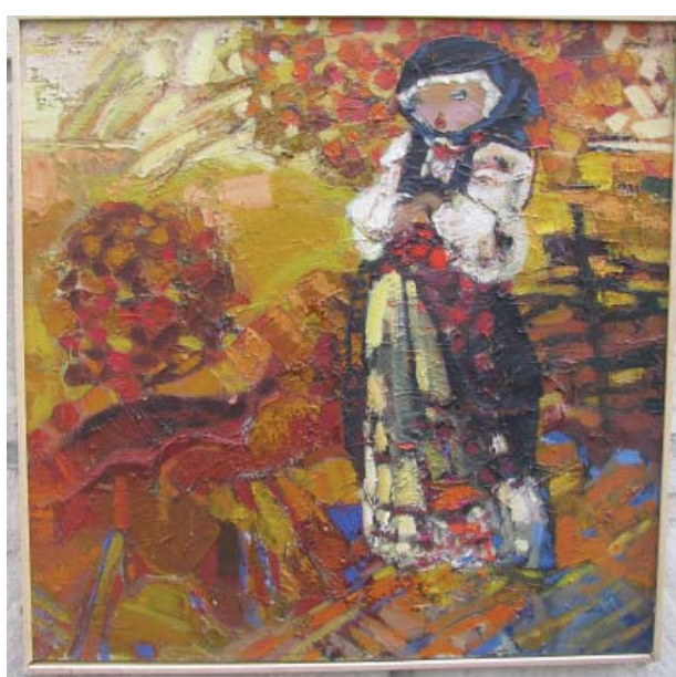
Așteptare. 2008, 700×700 mm, u/p