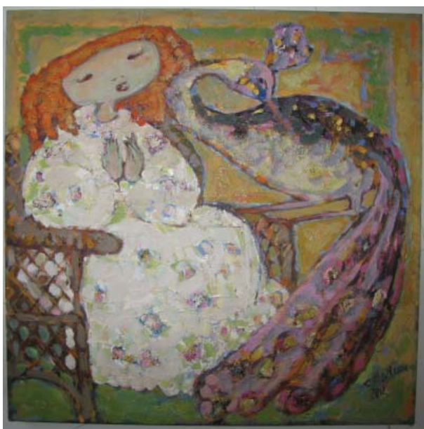
Pasăre albastră. 2008, 700×700 mm, u/p

Arta Eudochiei Zavtur ne impune convingerea că în opera de creare a celor mai simple obiecte, dezgolite de semnificație, o serie de pete colorate pot constitui o culme a perfecțiunii care relevă calitățile deosebite ale unei mari artiste.