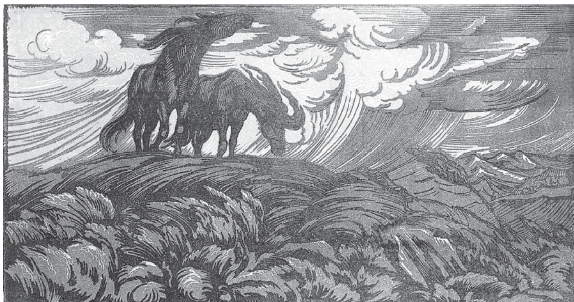
Pavel Șillingovski. Basarabia. Cai . 1916. Linogravură color pe hârtie

Să-l citim pe Paul Goma! Măcar atât îi datorăm.