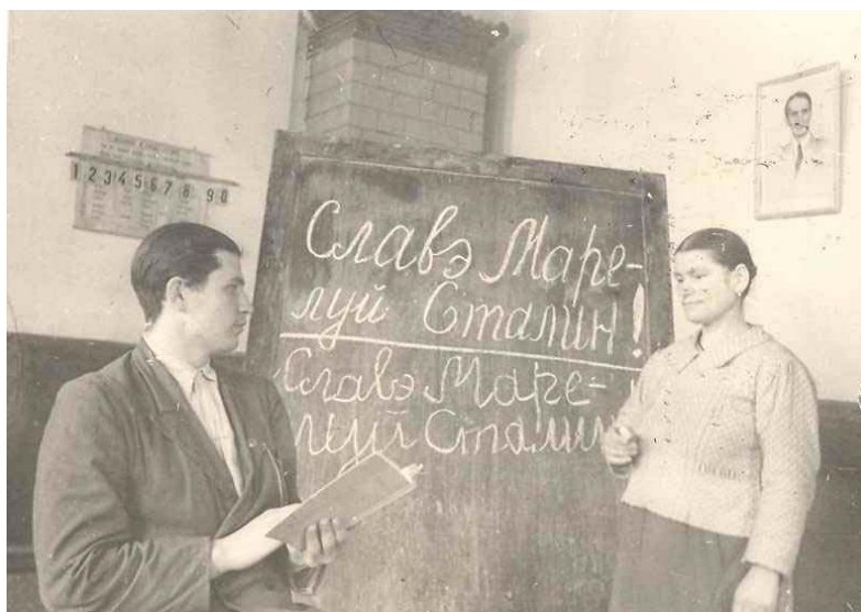
„Școala nouă” de sorginte sovietică

Nivelul general redus de cultură, precum și condițiile extrem de grele de viață ale populației, agra-