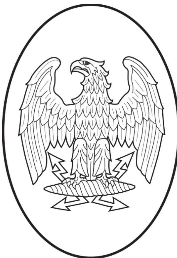
Stema Institutului de Fizică Aplicată

din mitologia greacă, stăpânul suprem al oamenilor și al zeilor, venerat încă din faza inițială ca zeu al trăsnetului și al oricăror mișcări atmosferice violente. Era socotit drept zeu al luminii, al fenomenelor naturale, era deținătorul și diriguiorul fulgerelor și trăsnetelor. În „Theogonia” lui Hesiod Zeus apare ca punct final al perioadei cele mai vechi de dezvoltare a lumii, care se naște din începuturi fizice abstracte (Ocean, Pământ și Haos) și treptat se apropie de o dezvoltare din ce în ce mai concretă, până când în sfârșit Zeus Cronid ia în mâinile sale sceptrul lumii și răstoarnă cu mâna victorioasă forțele potrivnice.