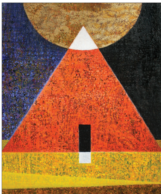
Andrei Mudrea. Noapte Egipteană . 2015, t. a. p. 100 × 80 cm

4) Clasificarea organizațiilor din domeniile cercetării și inovării pe categorii în baza performanței științifice stabilite de ANACEC și aplicarea unor scări tarifare diferențiate de remunerare a personalului științific al acestora (3 categorii de calificare științifică). Scara tarifară actuală ar putea fi utilizată în continuare în raport cu organizațiile de categorie inferioară, iar în raport cu celelalte organizații ar putea fi aplicați coeficienți de creștere salarială pentru performanță (spre exemplu, 1,2 – pentru organizațiile de categoria II și 1,4 – pentru organizațiile de categoria I).