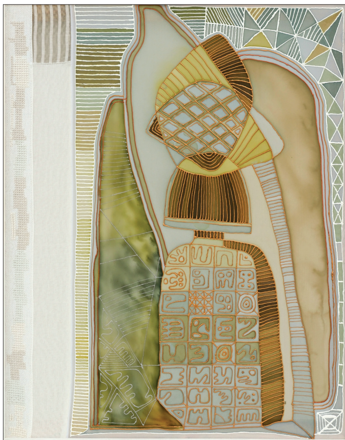
Tatiana Vatuva. Viziune , 2021, tehnică mixtă, 750 × 950 mm.

19. WIEWS – World Information and Early Warning System on Plant Genetic Resources for Food and Agriculture, [online] https://www.fao.org/wiews/data/ex-situ-sdg-251/overview/en/ (consultat: 20.11.2023).