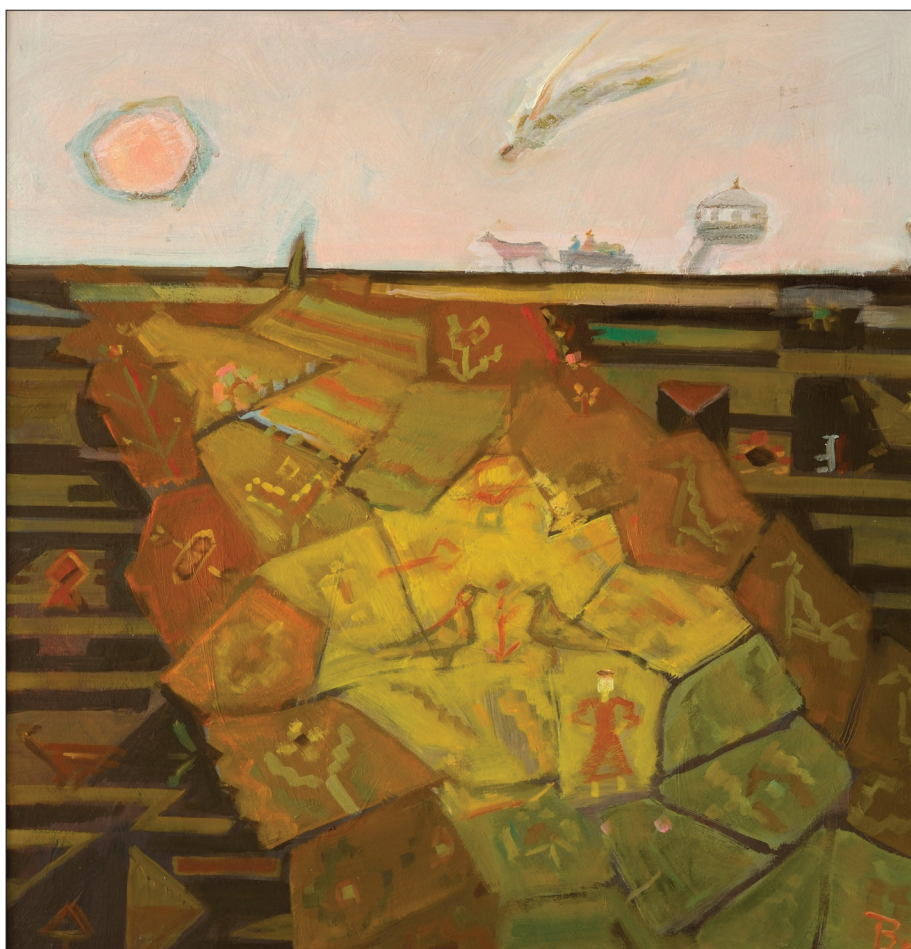
Timotei Bătrănu. Pământ peticit , 2018, ulei, carton, 51 × 50 cm.