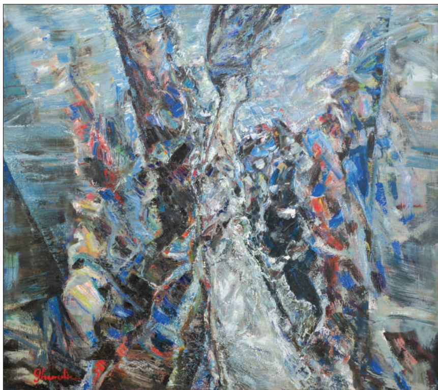
Ghenadie Jalbă. Stăpâna oglinzilor , 2018, ulei, pânză, 133,5 × 151,5 cm. Ciclul „Lumea oglinzilor strâmbe”. Colecția Muzeului Național de Artă al Moldovei.

Opera „profetului de la Scorțeni”, Axinte Frunză, reflectă frământările unei generații militante, preocupate mai mult de realizări practice ale unor mari proiecte naționale, scrisul constituind pentru aceștia un manifest-țintă. Opera sa a înființat o platformă pentru alți scriitori care vor beneficia de ceea ce a creat generația unioniștilor, elan frânt însă în urma includerii României în sfera de influență a Uniunii Sovietice.