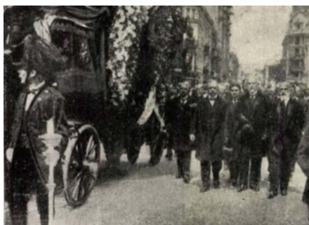
Fig. 3-6. De la înmormântarea fostului prim-ministru. Pornirea cortegiului de la vila Albatros spre gara din Buzău, Actualitatea , anul XII, nr. 5, mai 1925, p. 12.