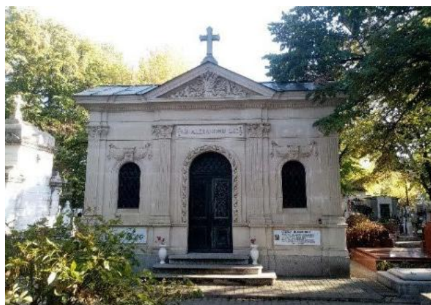
Fig. 7-8. Capela Marghiloman (Cimitirul Bellu/Șerban Vodă, București).