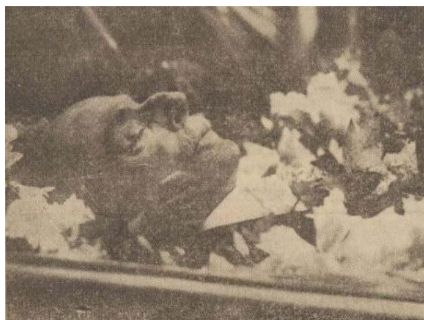
Fig. 1. Anunțul decesului lui Alexandru Marghiloman, Aurora , anul V, nr. 1051, din 13 mai 1925, p. 3.

Făcând referire la maladia gravă de care era afectat și analizând dintr-o perspectivă creștină suferința și condiția morții, același cotidian scria următoarele: „Marghiloman a suferit dureri sălbatice în ultimul timp. Cancerul angajând mai multe funcții și orga-