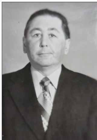
Figura 2. M. c. Vl. Țaranov, director al Institutului de Istorie al Academiei de Științe a RSS Moldovenești, 1981 [14].

Europei) (vol. I, 1988; vol. II, 1992); История СССР с древних времен до наших дней (Istoria URSS din cele mai vechi timpuri până în zilele noastre) (vol. XI, Moscova, 1980). De asemenea, el a participat la redactarea științifică a mai multor monografii, lucrări de sinteză, culegeri de studii și documente, reviste, enciclopedii etc.