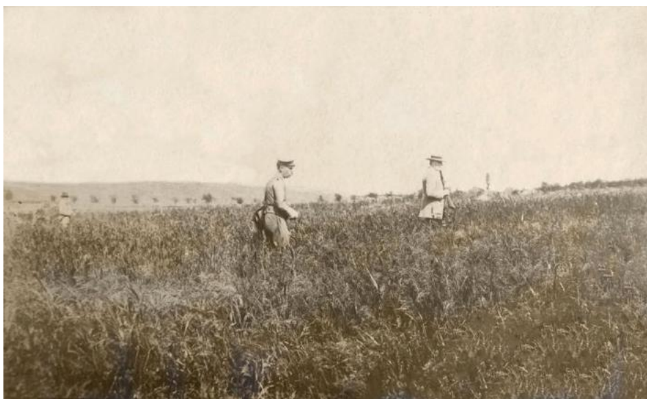
Marghiloman la vânătoare pe moșia Fundeni, însoțit de unul dintre șoferi, un apropiat și persoana care fotografiază, 1915.

și creșterea cailor de prăsilă pursânge englez are un farmec aparte pentru cititori, putând fi, totodată, și o sursă inedită în documentarea științifică a actualilor cercetători din domeniile de specialitate.