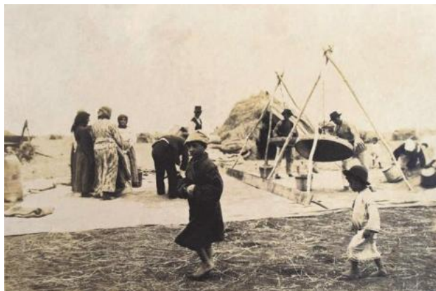
Instantaneu din timpul vizitei lui Al. Marghiloman pe moșia Fundeni, vara 1915. Familii de țărani la ciuruitul și încărcatul grâului în saci. În prim-plan, copiii desculți în mișcare