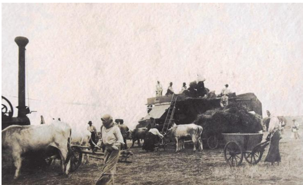
Vizita lui Marghiloman pe moșia Fundeni – vara 1915. Aspect din timpul treieratului mecanizat al grâului cu batoza acționată de locomobil; țărani încărcând snopii de grâu la batoză și animale de tracțiune.

printre care este petrecută o cravașă cu mâner de argint în forma literei A (Alexandru), toate acestea surmontând eșarfa tricoloră cu deviza ÎNAINTE .