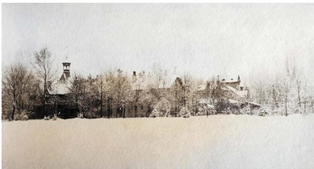
Complexul Marghiloman, iarna 1914–1915

de 90 de ani etc.). Pentru semnarea acestui tratat, dar și pentru că a asigurat o colaborare cu forțele străine de ocupație, Alexandru Marghiloman a fost receptat de mulți contemporani ca fiind un Trădător (colaborator cu dușmanul de moarte ), cu toate că „salvase dinastia și armata și adusese Basarabia la patria mamă” [8, p. 24]. Având o educație aleasă desăvârșită în cultura franceză, Alexandru Marghiloman, în fapt, manifesta o admirație și un respect deosebit pentru monarhia din România, în mod special pentru regele Carol I și, ulterior, pentru regele Ferdinand I, nu neapărat pentru Imperiul German.