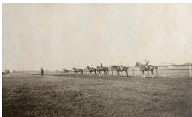
Secvență din timpul antrenamentului cailor de curse pe hipodromul de la Buzău, 1915