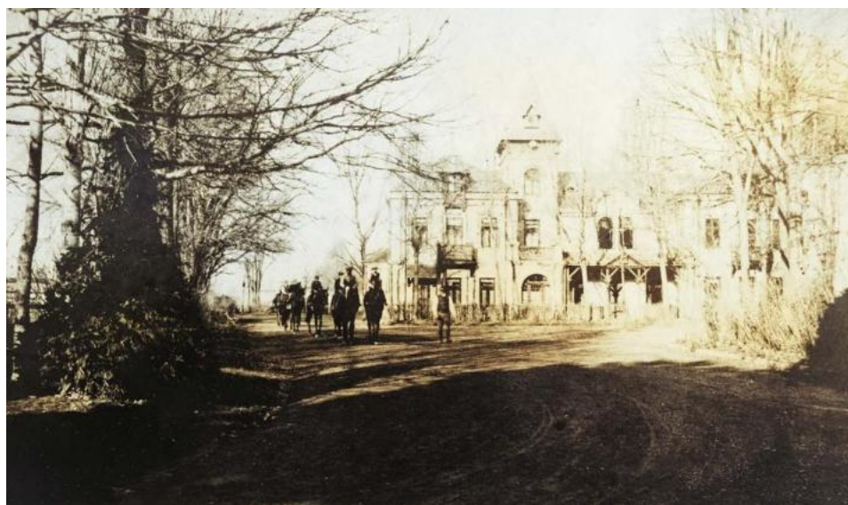
Vila musafirilor, jockey și cai de curse venind dinspre grajduri, prin poarta de serviciu spre vila Albatros, 1915

început, căci mai târziu și-a aranjat o popotă la Președinție) și nu îndrăzne să se arate în birturi, care erau de altminteri infecte. Se voir, s'entendre, s'aimer, ce fut l'affaire d'un moment! [...]. Marghiloman singur portrait beau părea încântat: lumea era a lui, căci era prim-ministru și era amoretat. Și când omul iubește, mai ales la o vârstă înaintată, toate îi par minunate. Pare că Providența alesese acest an 1918 ca să dea bietului Cono Aleco , deodată, cele două fericiri, după care alergase în zadar până atunci și ale căror raze au încălzit sfârșitul unei cariere mai strălucite în apa-