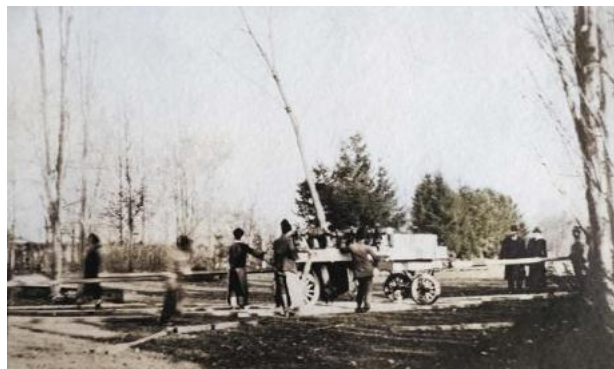
Lucrări de amenajări pentru pedestalul din marmură pentru bustul lui Alexandru Marghiloman. Transportul este supravegheat de un cuplu, probabil cei care au livrat blocurile, și un cadru militar.