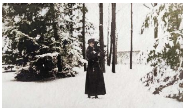
Personaj feminin, împreună cu Lăbuș, câțel din rasa Teckel, în parcul vilei, iarna 1914–1915

Partidului Conservator Progresist conducând până la dispariția sa ca formațiune de guvernământ.