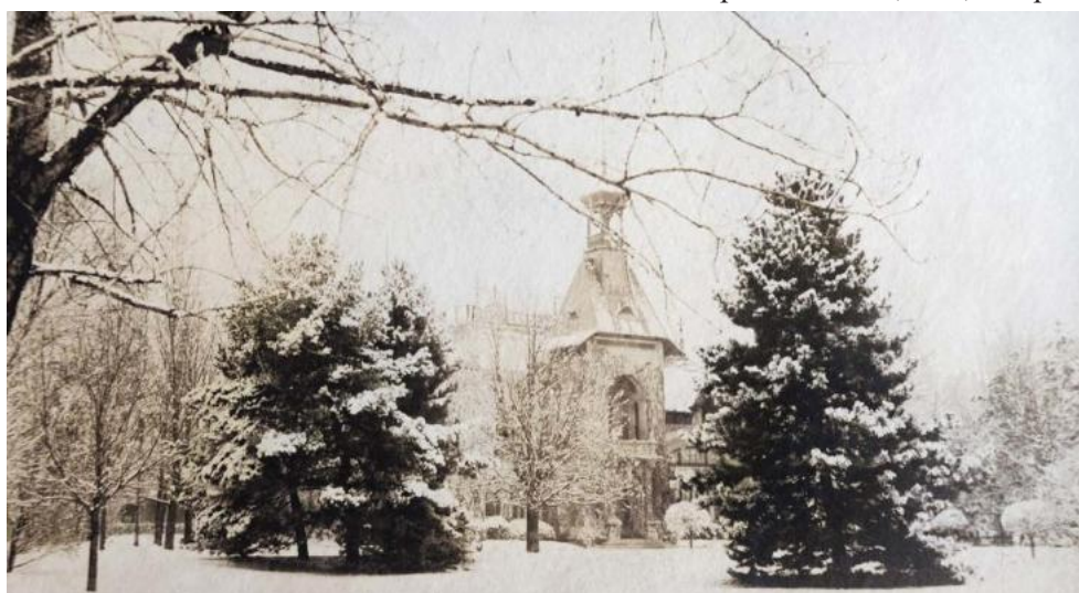
Vila Albatros, reședința din Buzău a lui Alexandru Marghiloman, iarna 1914–1915

Încă din 1918, Nicolae Iorga a surprins situația dificilă a Partidului Conservator-Progresist, condus de Alexandru Marghiloman într-un mod cât se poate de plastic: „îngropat așa de repede fără ca nimeni să se îngrijească măcar din milă să vadă dacă cel așa de grăbit îndesat în sicriu nu mai dă cumva semne de viață” [10, p. 116]. Noile realități politice, sociale și economice de după război au făcut practic imposibilă supraviețuirea, oricât de insistente au fost strădaniile liderului de a forma alianțe cu alte partide. În 1922, partidul nu a mai obținut niciun mandat de senator ori de deputat, devenind din ce în ce mai puțin relevant în noua configurație a scenei politice și a noului corp electoral, mult mai numeros după introducerea votului universal. Cauzele declinului au fost multiple, cele mai importante fiind, însă, incapacitatea de a se