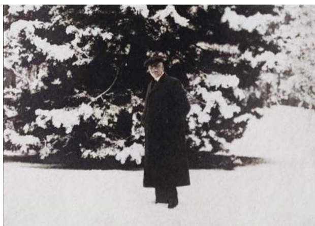
Alexandru Marghiloman la vârsta de aproximativ de 61 de ani, în parcul vilei Albatros , în iarna 1914–1915

adapta doctrinar noilor cerințe politico-sociale instalate după Primul Război Mondial și defăimările proliferate de adversari cu privire la colaborarea guvernului Marghiloman cu Puterile Centrale [11, p. 49]. În epocă au existat totuși voci care recunoscuseră sacrificiul său politic, făcut pentru păstrarea statalității.