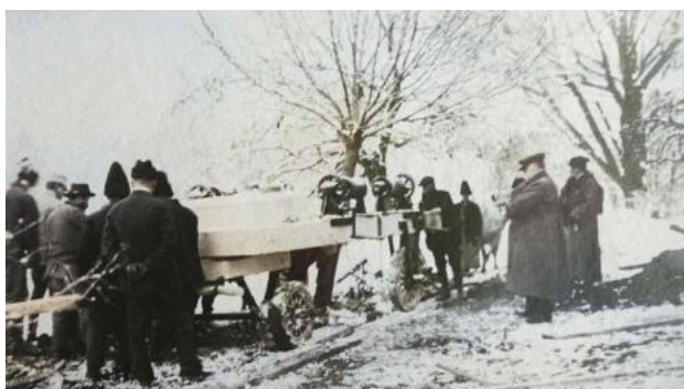
Lucrări de amenajare supravegheate de Alexandru Marghiloman – transportul unor blocuri de marmură albă necesare pentru amenajarea unui pedestal, pe care a fost așezat ulterior un bust de bronz.

Momentul de vârf al carierei sale politice și cel mai mare succes al guvernului Marghiloman a fost primirea actului Unirii Basarabiei cu România din 27 martie/9 aprilie 1918. Cu toate acestea, evenimentul a fost umbrat de semnarea păcii impuse de Puterile Centrale, aproximativ o lună mai târziu, în 24 aprilie/7 mai 1918. Sacrificiul său în acele condiții dramatice pentru țară a declanșat un declin politic ineluctabil, care a generat și scăderea popularității