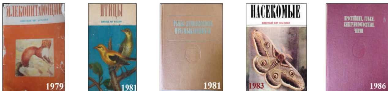
Figura 1. Seria „Lumea animală a Moldovei” (Zhivotnyy mir Moldavii), anii 1979–1986, Chișinău, Editura Știința: volumul I Mamifere ( Mlekopitayushchie ), 1979, 187 p.; volumul II Păsări ( Ptitsy ), 1981, 333 p.; volumul III Pești. Reptile. Amfibieni ( Ryby. Zemnovodnye. Presmykayushchiesya ), 1981, 225 p.; volumul IV Insecte ( Nasekomye ), 1983, 376 p.; volumul V Protozoare, spongieri, celenterate, viermi ( Prosteyshie, gubki, kishchnopolostnyye, chervi ), 1986, 370 p.